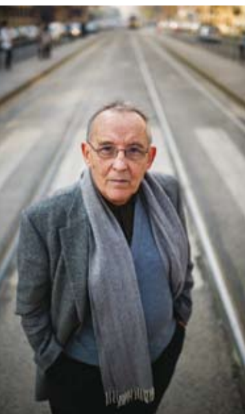
Vekerdy Tamás pszichológus

Miért nem állnak meg a magyar autósok a zebránál? Miért nem képesek kimozdulni a belső sávból? Miért köszönetnek meg egymásnak mindent, ugyanakkor miért torkolják le a náluk gyöngébbet? Melyik náció rosszabb sofőr autópályán, és melyik városban? Van-e bármi, amiért érdemesebb Magyarországon autózni, mint másutt? Olyan embereket kérdeztünk a fentiekről, akiknek a munkájához tartozik az autóvezetés, vagy más okból van összehasonlítási alapjuk.