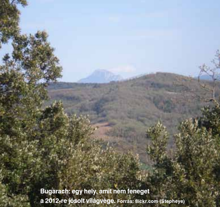
Bugarach: egy hely, amit nem fenyeget a 2012-re jósolt világvége.