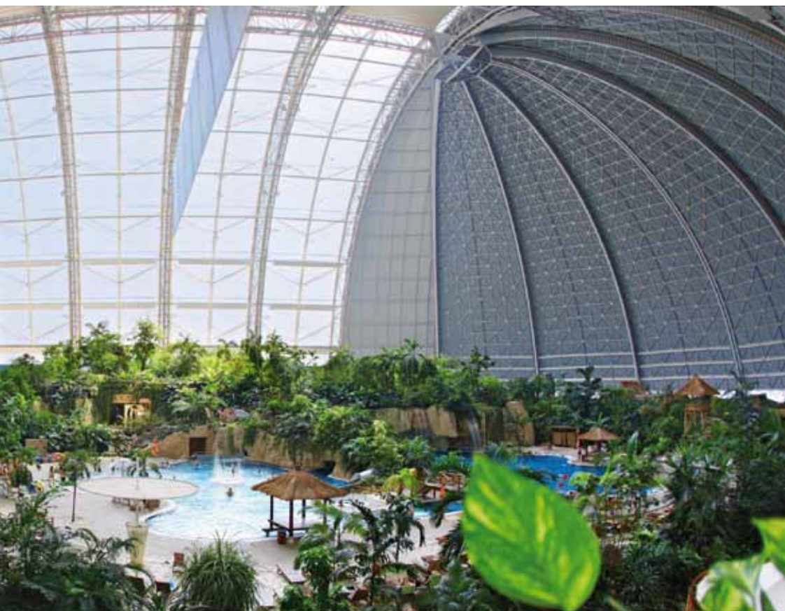
Őserdő télen-nyáron – kempinggel

dolnánk, hiszen Borneo partjainál, Mabulban már létezik egy ilyen szálloda, igaz, kisebb léptékben. Szintén figyelmet érdemel a Berlin melletti ex-szovjet katonai reptér újrahatszósítása is, ahol egy csődbe ment környezetbarát léghajógyár hangárjába egy mesterséges trópusi paradicsom