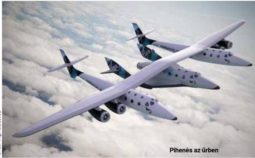
Pihenés az űrben

sának egyik legnagyobb húzása az űrutazás lehet. Ma még ez persze főleg sci-finek tűnik, de nem vagyunk olyan messze az űrturizmus megvalósulásától, mint azt hinnénk. A tervek szerint még 2011-ben lép a piacra új szolgáltatásával a vállalkozó kedvű milliárdos, Richard Branson, aki a Virgin Galactic nevű, űrutazást nyújtó cég alapítója (többek között). A Föld körüli kirándulásra máris 400 foglalás van, holott a 200 ezer dolláros jegyár azért kizárja bolygónk lakosságának jelentős részét. A négy hajtóműves WhiteKnightTwo (vagy SpaceShipTwo) repülőgép segítségével (amelyet 2010-ben sikeresen teszteltek) a tervek szerint 2011-ben szállítja az első turistákat az űrbe a Virgin, az új-mexikói Las Cruces település közelében direkt erre a célra kialakított Spaceport America állomásról. A cég weboldalán ( http://www.virgingalactic.com ) jegyet is lehet foglalni a különleges utazásra, de arról még nincs szó, mikor indul az első Föld körüli turistajarat.