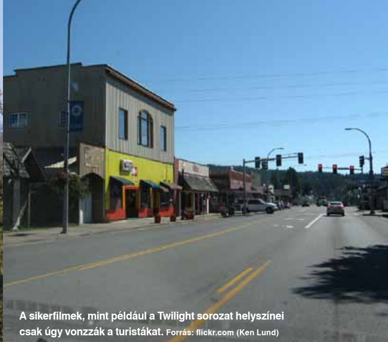
A sikerfilmek, mint például a Twilight sorozat helyszínei csak úgy vonzzák a turistákat.

Berlin mellett egy ex-szovjet katonai reptér újrahasznosítása során egy csődbe ment környezetbarát lég-hajógyár hangárjába mesterséges trópusi paradicsom épült.