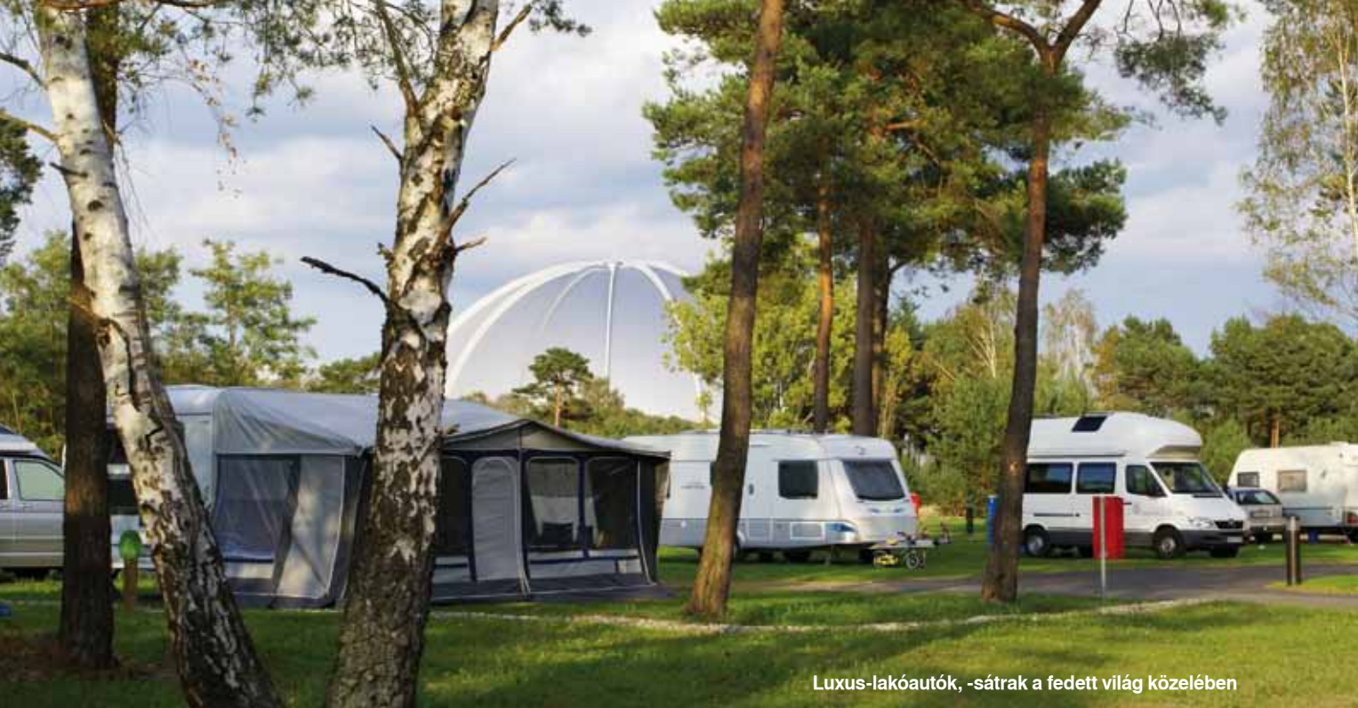
Luxus-lakóautók, -sátrak a fedett világ közelében