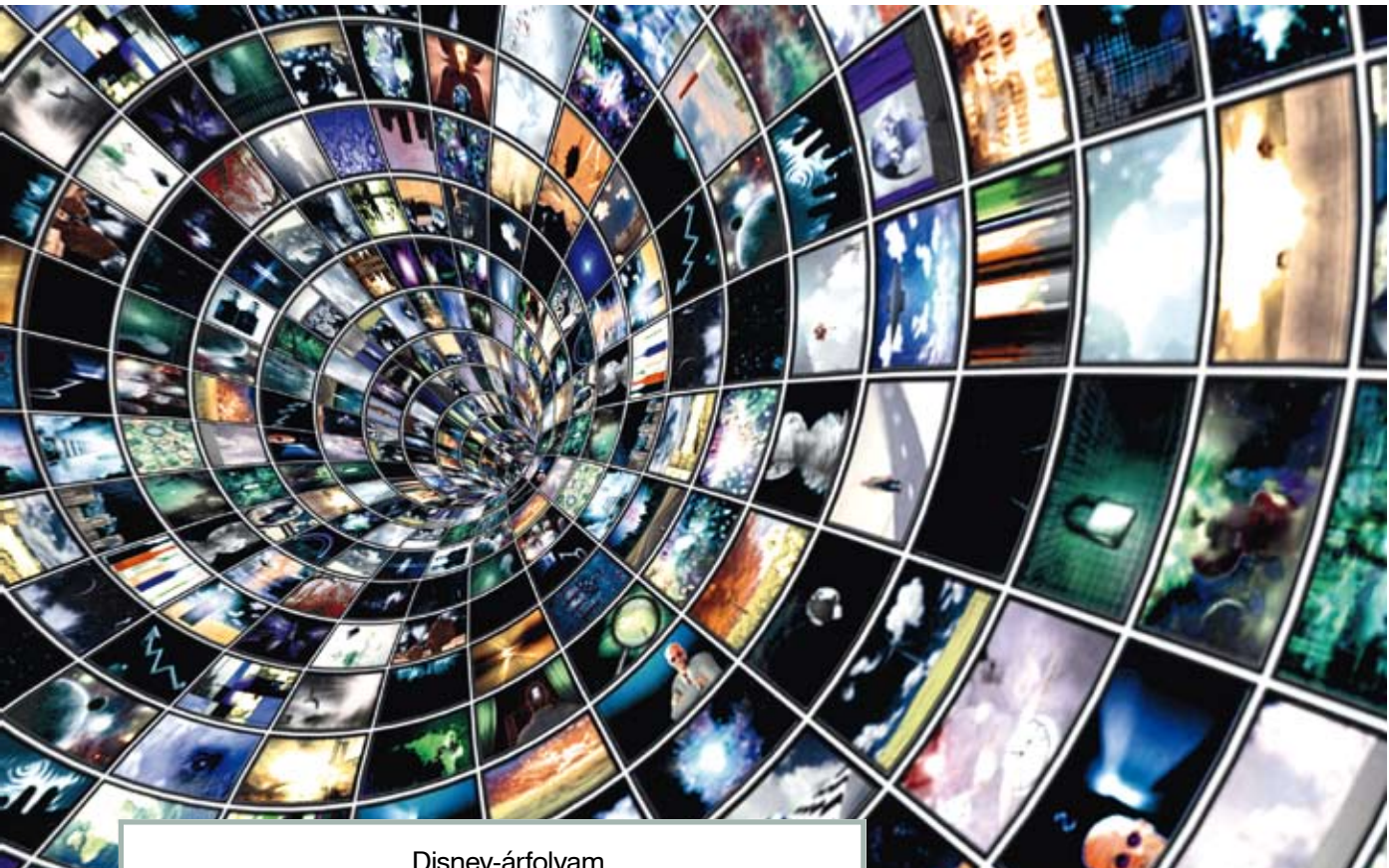
Disney-árfolyam (2009. 01. 01. – 2010. 08. 31. között, dollár)