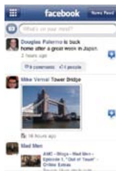
A legnépszerűbb közösségi oldal, szinte minden mobilra