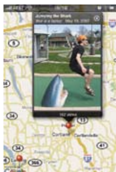
Twitter-üzenetek, képek, videók, feltöltése iPhone-ról

Windows Mobile rendszer esetében talán a MoTweets lehet a legjobb választás (az ingyenes